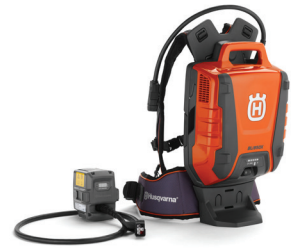
AKKU-RUCKSACK BLI950X 967 09 32-01