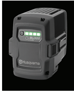
AKKU BLI300 967 07 19-01