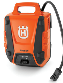
AKKU-RUCKSACK 579 82 22-01