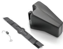
BIOCLIP®-KIT 597 41 37-01