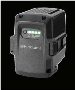
AKKU BLI200 967 09 19-01